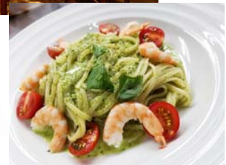
※料理写真はイメージです

※ FAXにてお申込みの場合、下記ご記入の上切取線より下のみお送りください ----- 切り取り -----